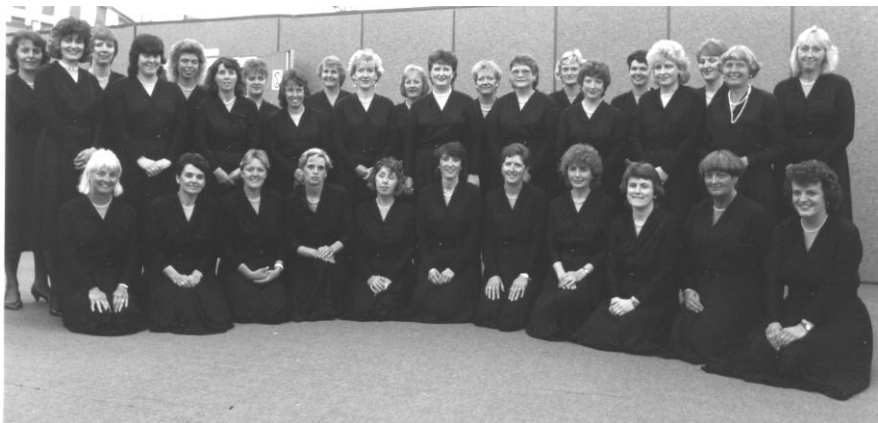
Eisteddfod Cwm Rhymni 1990

"Lleisiau ifanc rhagorol a chafwyd unoliaeth lleisiol hyfryd. Ymdriniaeth wych o'r awdl. Diweddglo gorfoleddus i'r garol."