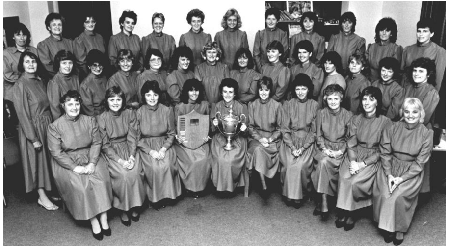
Llun ar gyfer Cyngerdd yr Urdd yn 1988