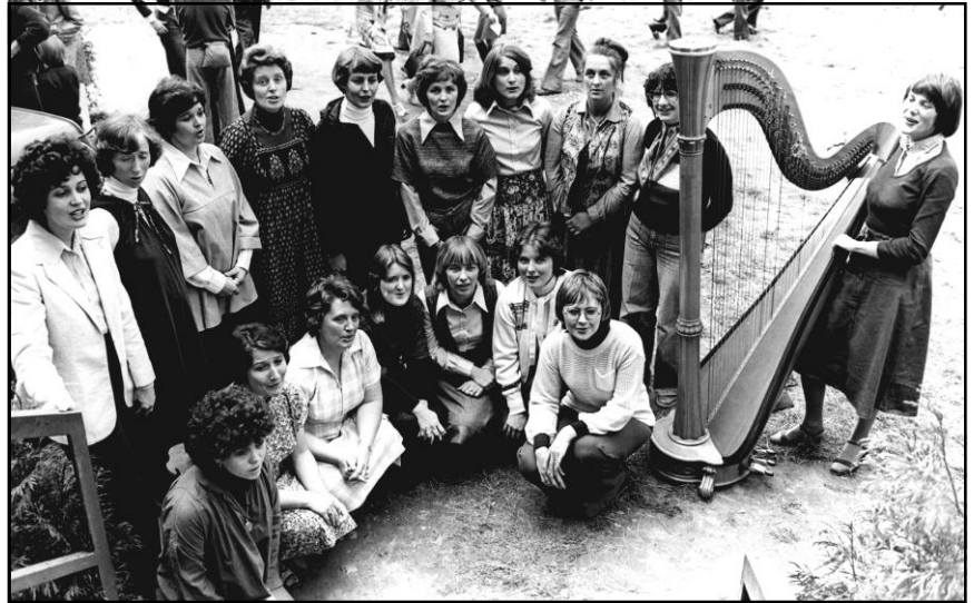
Parti Merched y Garth yn cystadlu yn Eisteddfod Caerdydd 1978.

Mae'r côr wedi ennill naw gwaith yn yr Eisteddfod Genedlaethol, pum gwaith yn yr Ŵyl Gerdd Dant ac wedi bod yn bencampwyr yr Ŵyl Ban-Geltaidd. Mae arweinyddion y côr wedi ennill dwy fedal - Medal Aur Clogau a Medal Noel John a gwahoddwyd y côr i fod yn rhan o ddathlu agor y Cynulliad Cenedlaethol.