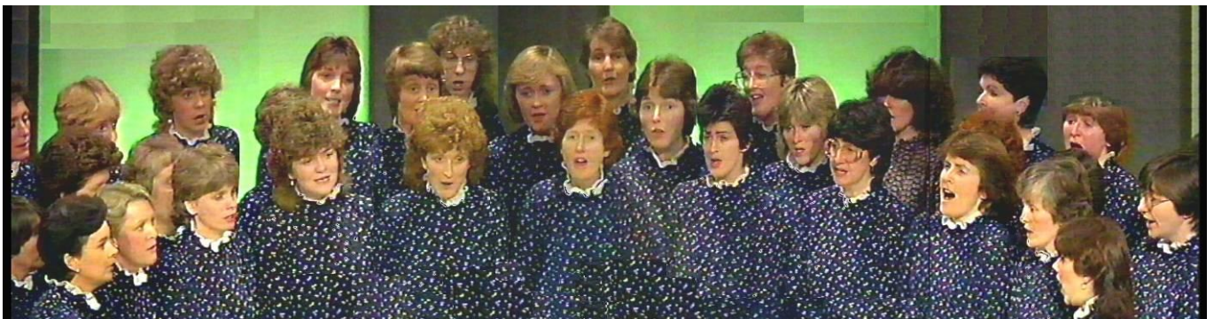
Gŵyl Cerdd Dant Dyffryn Lliw 1985