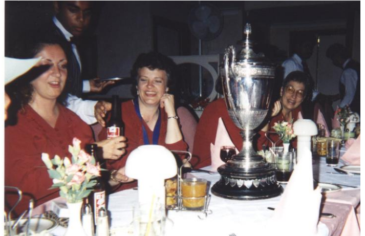
Dathlu llwyddiant Eisteddfod Bro Ogwr 1998