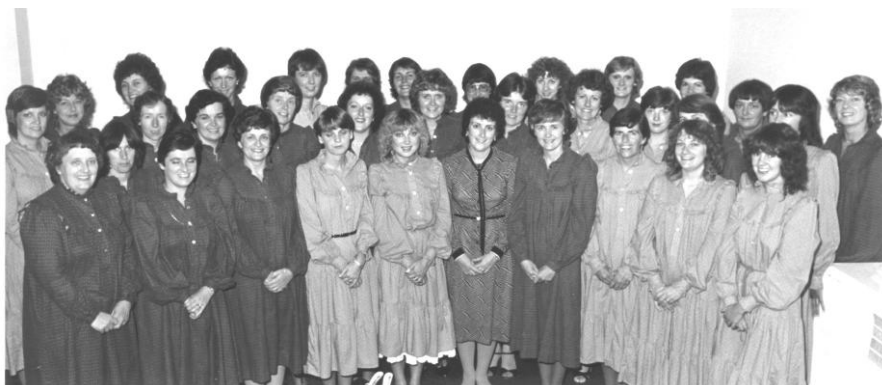
Llun o glawr y record, Telyn Cymru 5, 1982