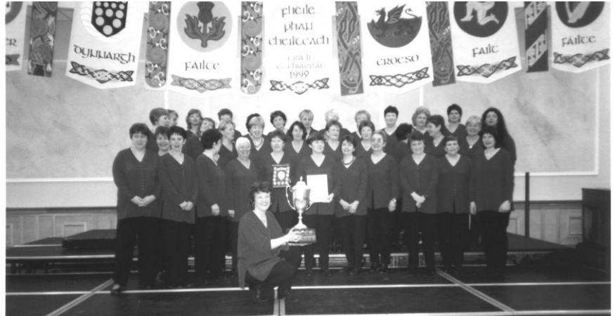
Trá Li yn 1999

Cawsom bedwar diwrnod i'w cofio yno ac yn goron ar y cyfan cael dod yn ôl i'r gwesty yn Waterford i wylio tîm rygbi Cymru yn curo'r Saeson. Bydd yn rhaid trefnu taith arall i'r ŵyl cyn hir!