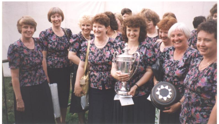
Eisteddfod Genedlaethol Castell Nedd 1994