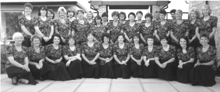
Canu mewn Noson Lawen yn Llanwrtyd 1993.