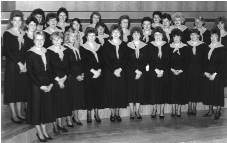
Gŵyl Telynu'r Byd 1991 yn Neuadd Dewi Sant