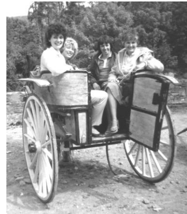
Crwydro Iwerddon yn 1984