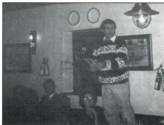
Roedden nhw'n dawnsio ar ben y byrddau yno!

Ddechrau Ionawr daeth criw bychan at ei gilydd i lunio rhaglen ar gyfer y flwyddyn. Gobeithio bod yna rywbeth a fydd yn apelio at bawb. Y nod yw cynyddu aelodaeth y Gymdeithas yn ystod y flwyddyn a rhoi cyfle i bawb fwynhau eu hunain yn Gymraeg. Mae'n hynod o galonogol gweld nifer o ddysgwyr yn ein cefnogi eisoes. Os gwyddoch am unrhyw ddysgwyr sydd am ymarfer eu Cymraeg yn ardal Llantrisant, yr Efail Isaf, Ton-teg, Tonyrefail, da chi dewch â nhw gyda chi i gyfarfodydd y Gymdeithas.