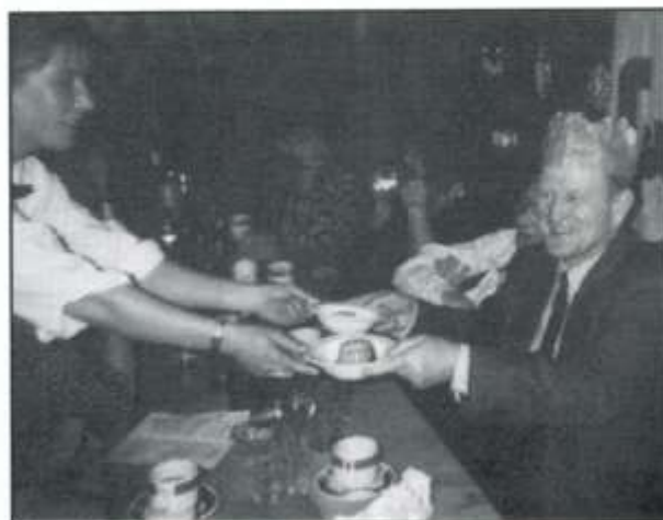
Y pumed neu'r chweched pwddin, Gwilt?

Os oes unrhyw un â syniadau am weithgareddau ychwanegol, byddem yn hynod falch o glywed gennych (223282, 228196 neu 228143).