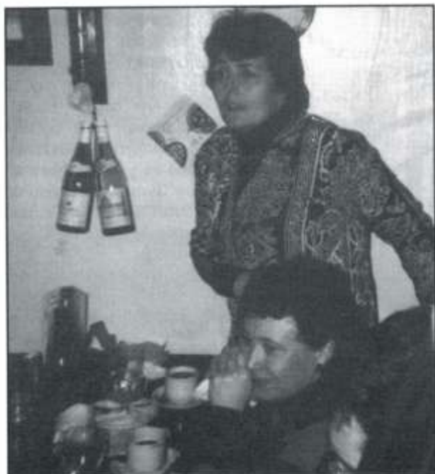
Yy, ma gin i boen yn 'y mol ...

Noswyl Nadolig, yn ôl yr arfer, cynhaliwyd gwasanaeth Plygain yng Nghapel y Tabernacl, Pontyclun. Cynhaliwyd Plygain y Gymdeithas ym Mhontyclun yn ddi-dor ers rhyw ddeng mlynedd bellach.