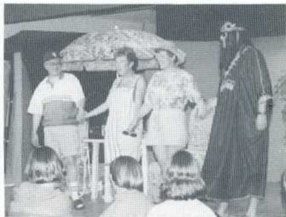
Cwmni'r Dwrllyn B

barbiciw, a hanner Gerddi Tŷ Dyffryn. Ond mi roedd y set yn effeithiol a'r 'gormodedd' yn nodweddiadol o naws y ddrama yn gyffredinol. "Dros ben llestri" yw'r ymadrodd sy'n gweddu orau i'r cynhyrchiad hwn - o'r 'hipi' Cymreig â'r acen Ffrengig i'r cynllun hollol anghredadwy o gilio bant i'r Wyl Werin yn Llydaw. Cafwyd 'caricature' hyfryd o'r Cymro Cydwybodol Cymreig na fethodd 'Steddfod Genedlaethol ers 1958 - ac roedd y portread o'r cymeriad hwn yn arbennig o dda.