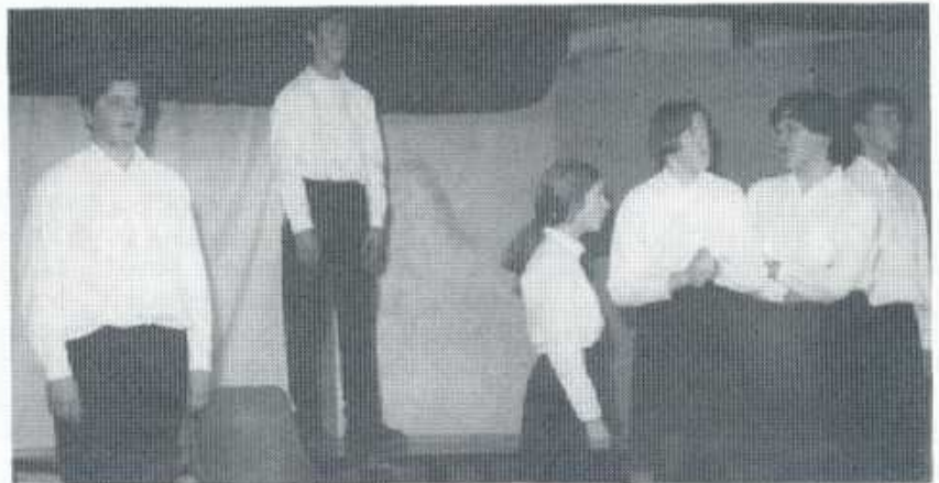
Dan y Wenallt - Cwmni Gwynllyw