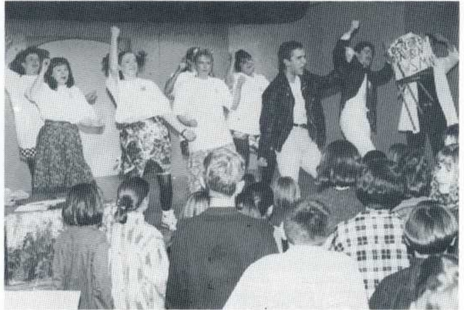
Y gynulleidfa ar eu traed yn Saim