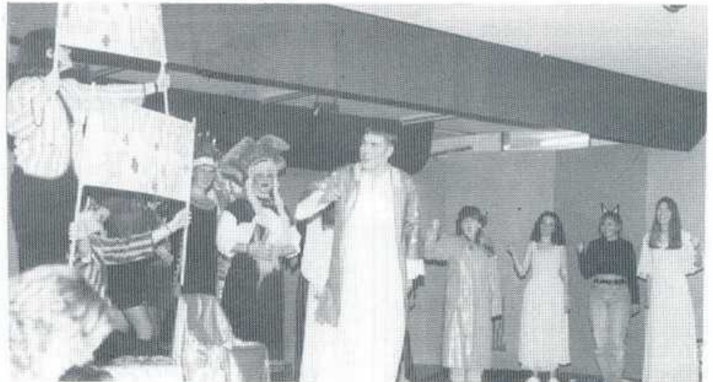
Y Dewin yn y Pantomeim