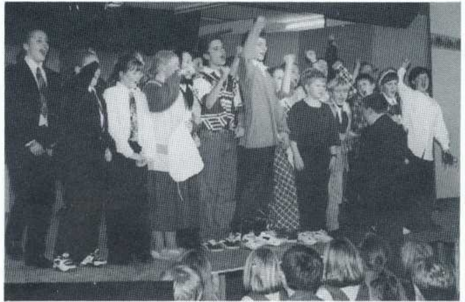
AGI, AGI, AGI - Cwmni Menter Taf Elái

Hoffais y gerddoriaeth yn fawr a'r cyfeiliant yn broffesiynol tu hwnt. Roedd y plant yma wrth eu boddau ar y llwyfan ac roedd yn gynhyrchiad llawn egni a brwdfrydedd. Daliwch ati Ysgol Bronllwyn - mae gennych dalentau mawr yma!