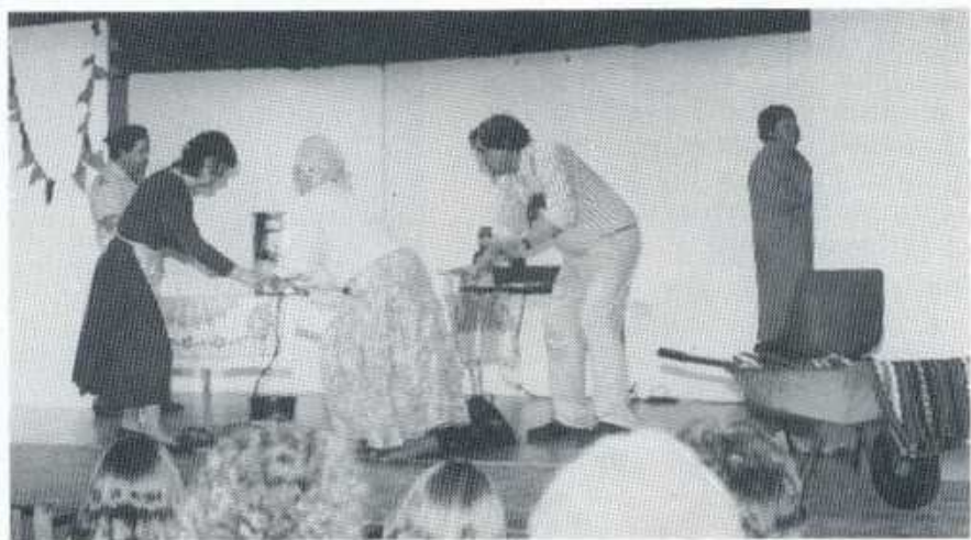
Cwmni Cwm Ni