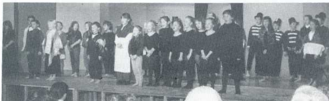
"Beca" Cwmni Bronllwyn

Trueni na fuasai'r detholiad ychydig yn hwy.