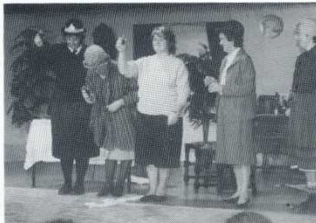
Cwmni'r Dwrllyn A

Perfformiad graenus iawn gan y cwmni yma - er gwaetha'r ffaith bod aelod o'r cast gwreiddiol ar goll.