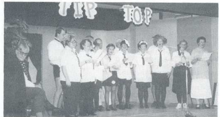
Noson lawen "Tip Top"