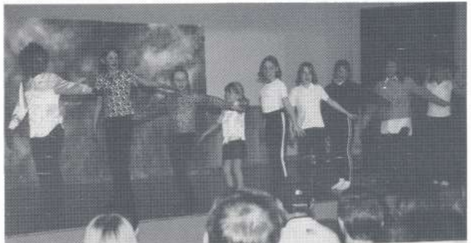
Traed y Ddraig

Da iawn am gystadlu roedd yn braf weld plant oedran ysgol gynradd ar y llwyfan.