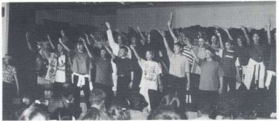
Ysgol Gyfun Rhydfelen