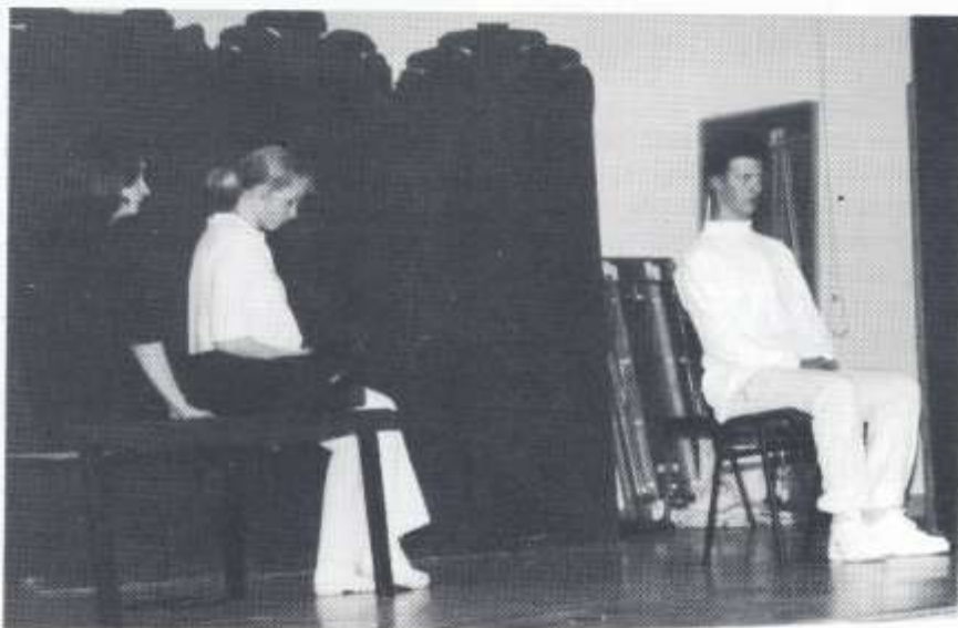
Cnawd - Ysgol Cwm Rhymini