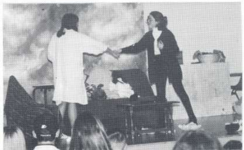
Ysgol Gyfun Rhydywaun

Cyd chwarae da ond angen datblygu at uchafbwynt.