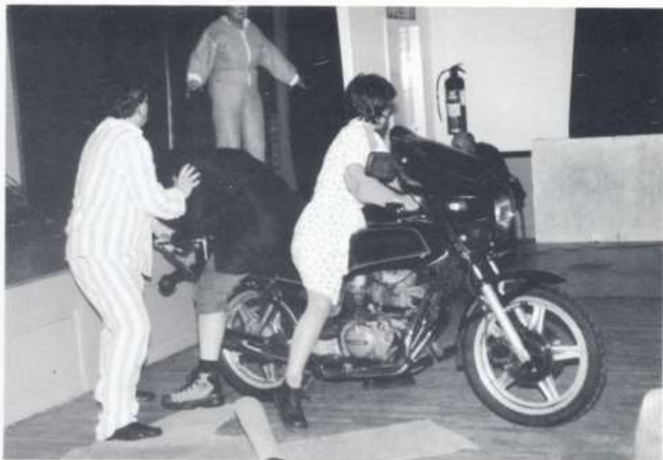
Mis Mêl - Cwmni'r Pentref

Testun anodd iawn yn trin a Masectomy. Fe wnaeth y tri yma ymgais arbennig iawn eto roedd y llefaru yn rhy lithrig, yn colli cymalau a geiriau. Weithiau mae gwerth saib yn bwysicach na'r geiriau eu hunain.