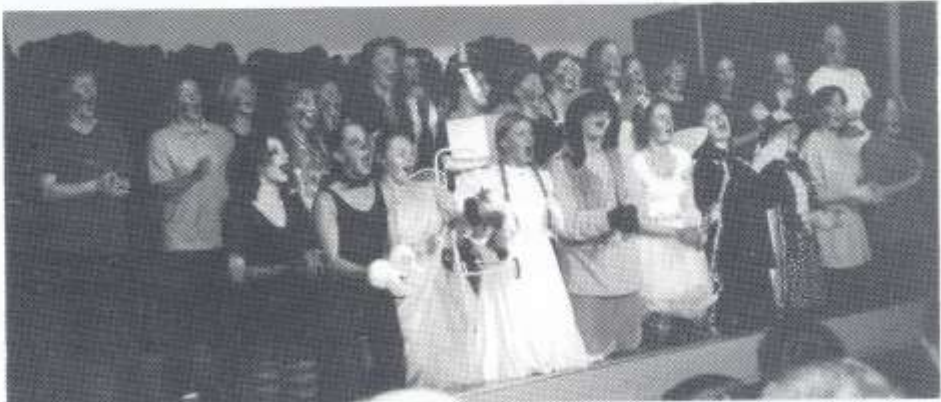
"Oz" Ysgol Gwynllyw