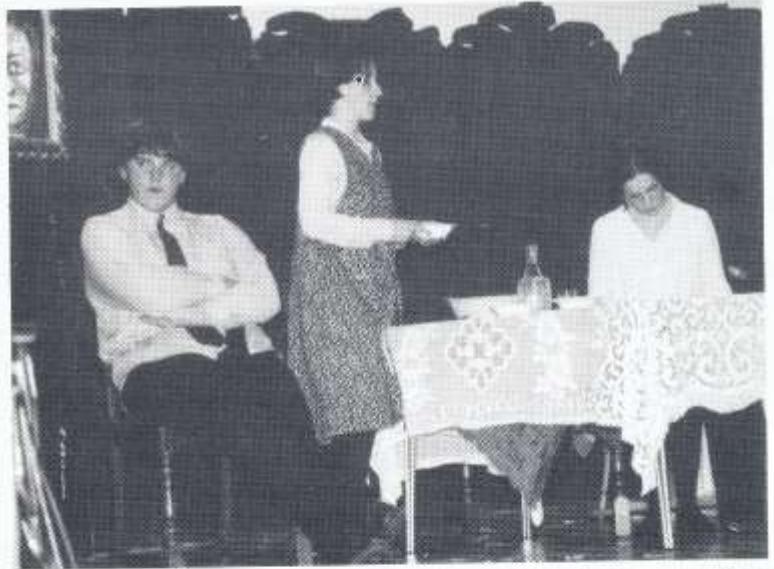
Pethau Brau Ysgol Gwynllyw