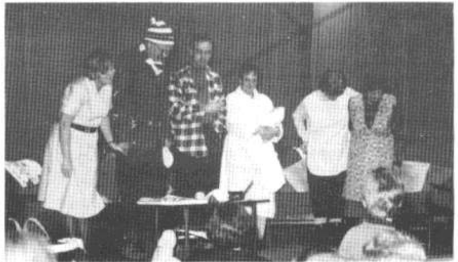
Sgorio - Cwmni Crwys A