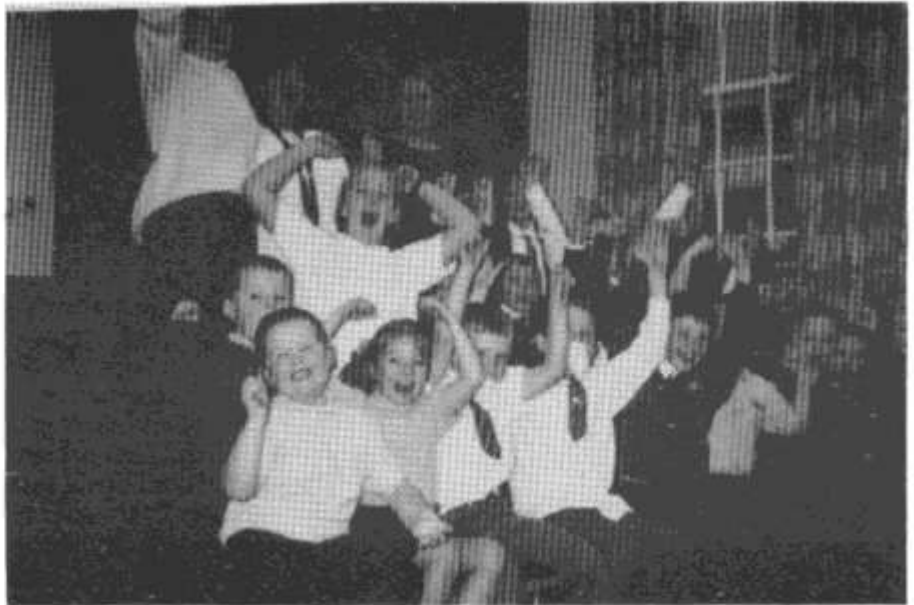
Parti agor Clwb Carco y Dolau

Dwi'n ymffrostio yn llwyddiannau'r Fenter Iaith bob mis a gellid dweud bod llawer o lwyddiannau eraill hefyd - Mudiad Ysgolion Meithrin, Urdd Gobaith Cymru ers blynyddoedd lawer, Merched y Wawr, CYD, Addysg Gymraeg, Rhieni Dros Addysg Gymraeg, Radio Cymru, S4C un ac S4C dau ac S4C digidol, Menter a Busnes, Cymraeg i Oedolion a hyd yn oed Bwrdd yr Iaith Gymraeg. Ond ydyn ni'n gwneud yn dda mewn gwirionedd?