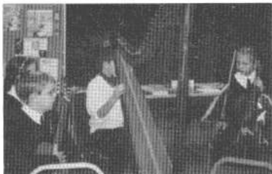
Grŵp offerynnol Llanhari