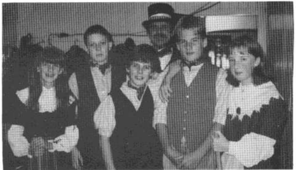
Grŵp Stepio Llanhari