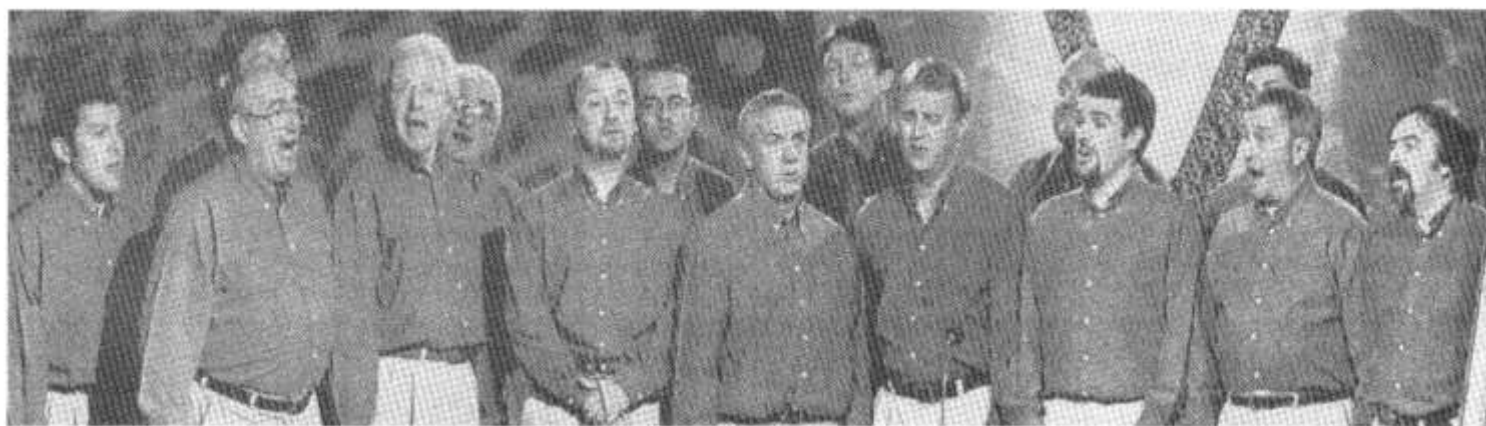
Parti'r Efail yn cystadlu yng Ngŵyl Cerdd Dant Corwen ym mis Tachwedd

Dyma blant Cylch Meithrin Creigiau gyda'u rhieni a'i brodyr a chwirydd yn mwynhau trip ar fws to agored o gwmpas Caerdydd. Gofynnodd Cwmni Teledu Antena os fydde diddordeb gan y Cylch gymeryd rhan mewn cyfres newydd o'r rhaglen deledu plant 'Tŷ ni, Tŷ chi'. Trafnidiaeth fydd pwnc trafod y gyfres newydd. Roedd y plant yn arbennig o dda tra'n cael eu ffilmio, ac yn lwcus fe gawsom dywydd bendigedig. Fe fydd y rhaglen yn cael ei ddarlledu yn gynnar yn y flwyddyn newydd.