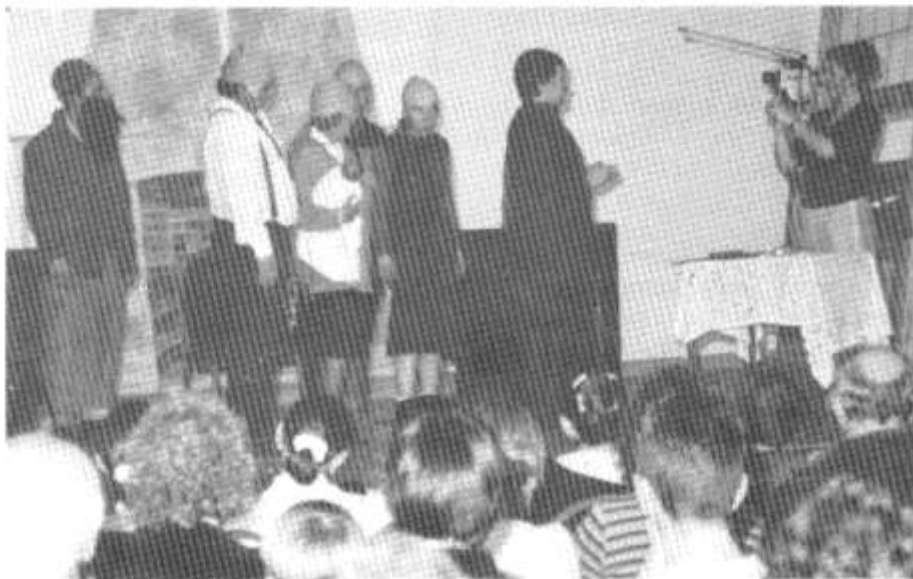
Y Miliwniwn - Cwmni'r Pentref

Cwmni'r Pentref Dyma orffen gwych i'r ŵyl. Cawson ni noson o chwerthin - does dim byd gwell. Roeddwn ni'n meddwl i ddechrau ein bod ni'n mynd i gael perfformiad amlgyfryngol arbrolol gyda'r ddraig a'r filach i ddechrau S4C3. Ar ôl y pwt o newyddion ar y teledu gawson ni gomedi sefyllfa fach wirioneddol dda efo caracatures go iawn. Sgript yn dda gyda sylwadau bachog. Roedd hi'n weladwy a doniol gyda'r gynulleidfa yn chwerthin o'r dechrau i'r diwedd. Llongyfarchiadau i chi.