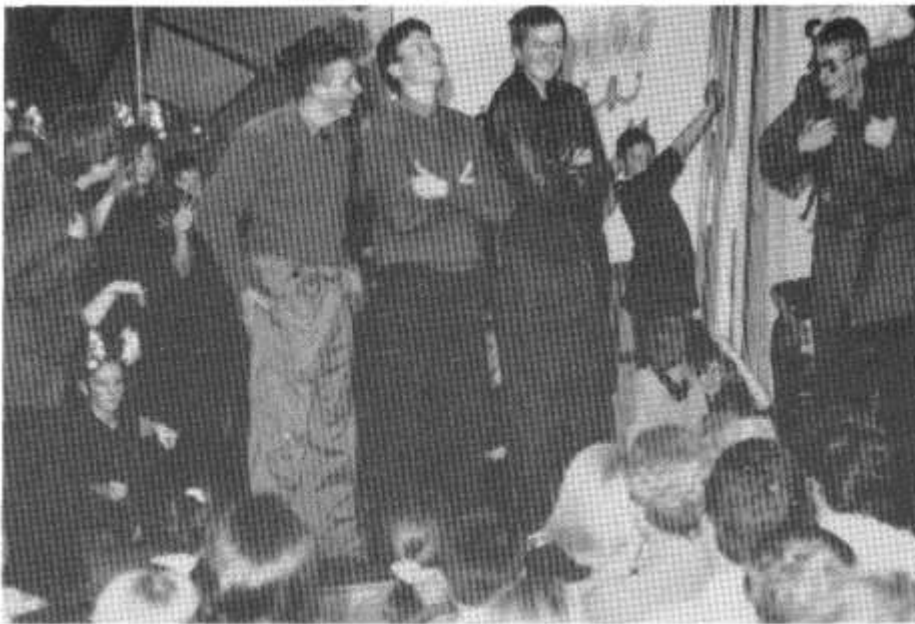
Byg y Mileniwm Ysgol Rhydfelen