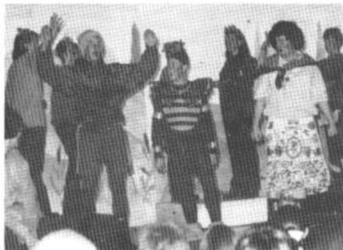
Golygfa o Bantomeim Ysgol Llanhari