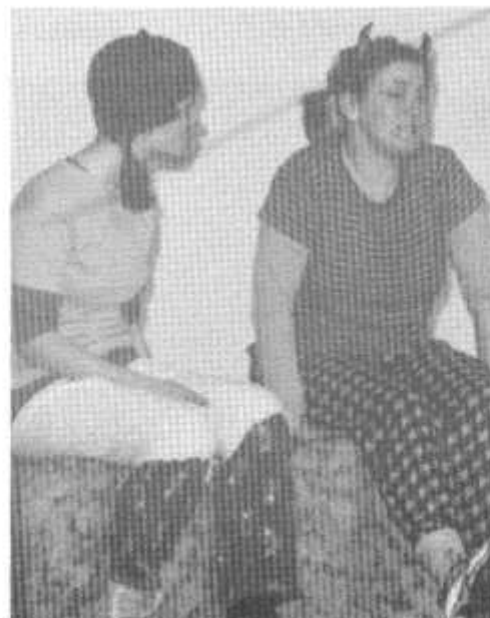
Wrth Aros Godot - Ysgol Glantaf