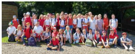
Trip Bl 5 a 6 i Heatherton