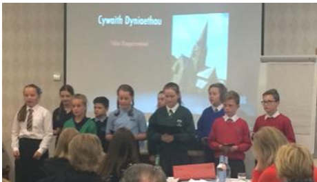
Cyflwyniad Cynhadledd Ysgolion Cymraeg