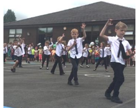
Dathlu penblwydd Castellau'n 30 oed