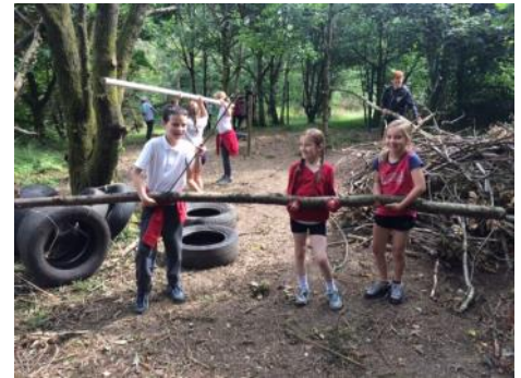
Hwyl yn Parc Gwledig Dâr