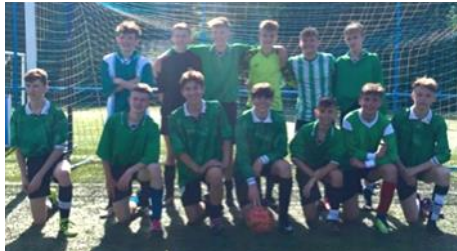
Timau Pêl-droed (Tudalen 12)