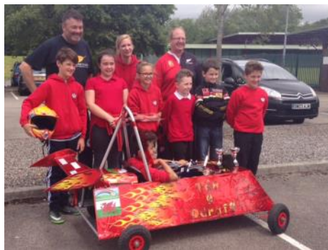
Tân y Ddraig