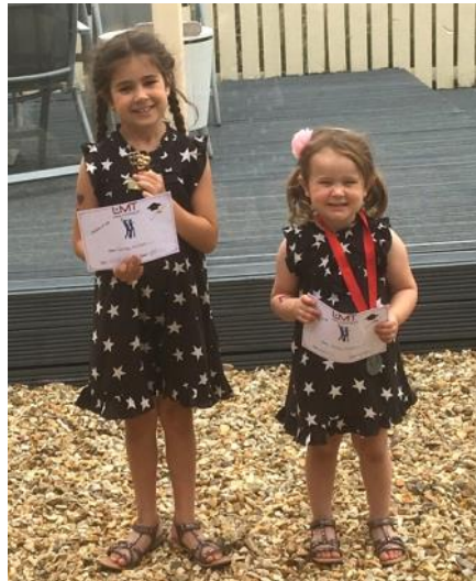
Chwirydd Walters Gilfach Goch (Tudalen 5)