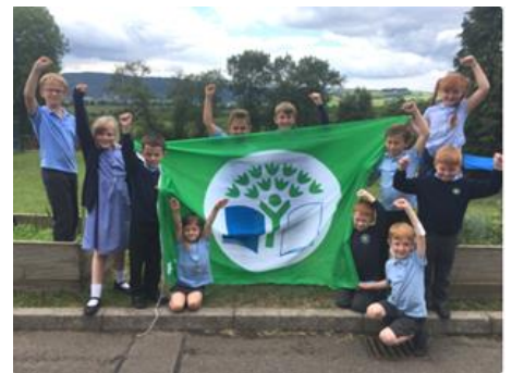
Y Faner Werdd