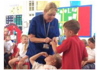
Gwaith Nyrs gyda Bl3