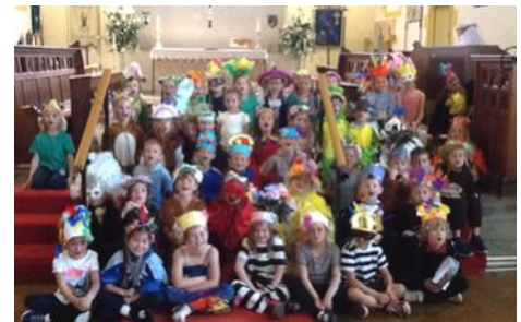
'Rio' Sioe Bl 1 a 2