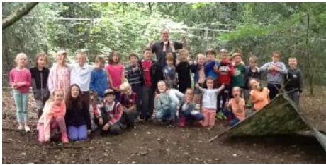
Gwobr Presenoldeb - Bushcraft