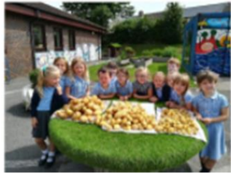
Cynnyrch gardd yr ysgol