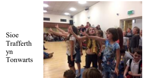
Sioe Trafferth yn Tonwarts