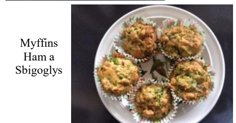
Myffins Ham a Sbigoglys