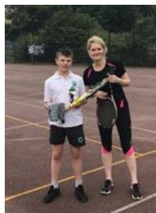
Enillwyr y Gystadlaeth Tennis