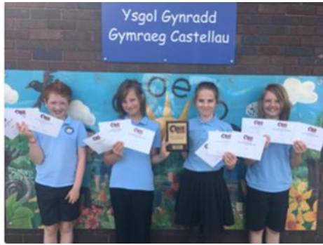
Mathemategwyr o Fri