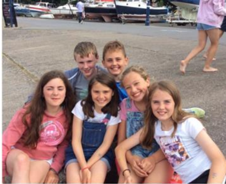
Taith i lan y môr