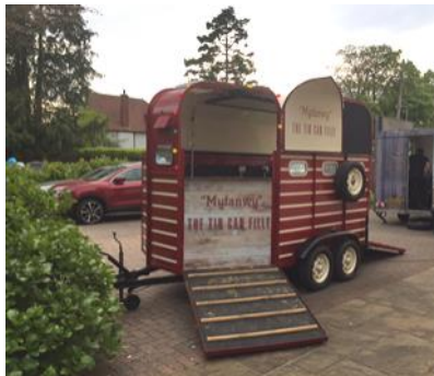
'Myfanwy' y bocs ceffylau defnyddiol