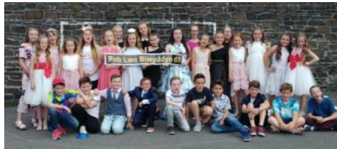
Parti Ffarwelio Bl 6

Diolch i bawb am gefnogi elusen Bradley Lowrey – daeth y plant i'r ysgol yn gwisgo gwisg pêl-droed neu yn eu hoff liw. Fe gasglwyd £130 tuag at yr elusen.